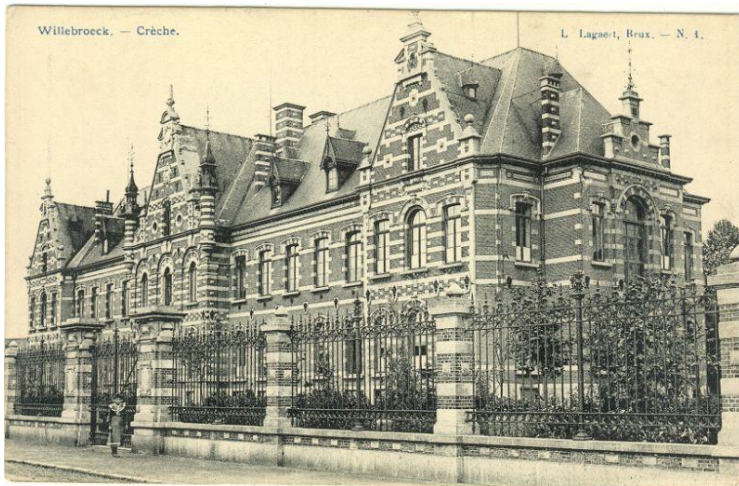
De vroegere "crèche" van De Naeyer, aan de Mechelsesteenweg (fotoarchief Willebroek, 1906)

De crèche was van 8 tot 16 uur gratis toegankelijk. Zowel voeding als hygiënische verzorging, werden er gratis verstrekt. In 1890 was er al sprake van 100 kinderen in de categorie van 0 tot 3 jaar. De kinderen van 3 tot 6 jaar (zij waren in 1890 met 260) werden van 8.30 uur tot 4 uur in de namiddag, door geschoold personeel opgevangen. Zij kregen er hun middagmaal, en werden er door een dokter gratis verzorgd. In dezelfde crèche was er een douchezaal en stonden de baden ter beschikking van de werknemers en hun familieleden. En op deze manier kon Louis De Naeyer een beroep doen op de (goedkopere) vrouwelijke arbeidskrachten.