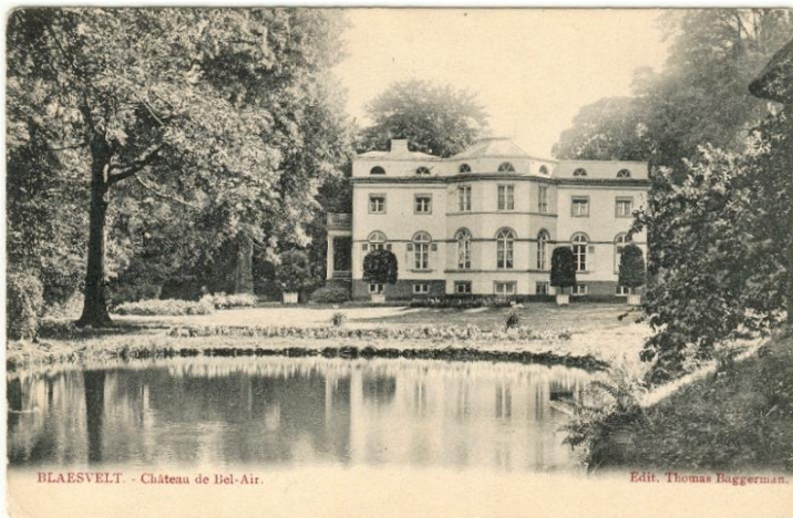
Kasteel Bel-air in vroegere tijden

Het kasteel diende tijdens de wintermaanden als jachtslot en in de zomer als buitenverblijf. Het kwam later in handen van de familie de Wargny, die het in 1921 aan de brouwersfamilie Van den Bogaert verkocht. Het kasteel werd in 1965 verbouwd en deels gesloopt. Het park rond het kasteel werd aangelegd als een typisch Engelse landschapstuin met een bijhorend tuinhuis.